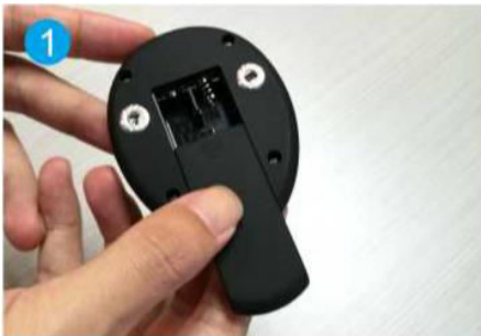
1. Aprire il vano batteria