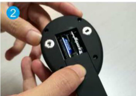
2. Inserire le batterie (2xAAA)